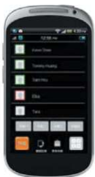
M54 App for Android Phone