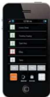
M54 App for iPhone